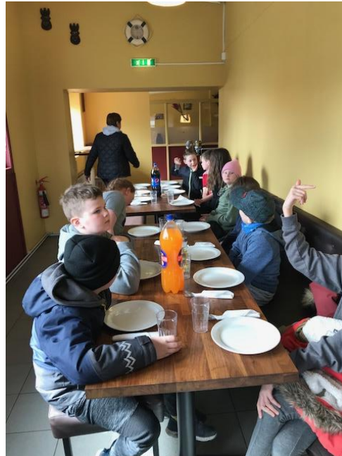
Hestafjör Hmf. Sleipnis og pizzaveisla á heimleiðinni!

Hugmyndin er að vera aftur með svipað verkefni núna í haust, og vonandi tekst okkur það. Það háir þó flestum krökkunum hestleysi en ef krakkar hafa virkilegan áhuga á hestum og vilja stunda hestamennsku eins og hverja aðra íþróttagrein þá er mikilvægt hafa hest við sitt hæfi og viljum við því að foreldrar hafi það í huga. Við gerum okkur grein fyrir því að hestar þurfa fóður og húspláss og það þarf að moka undan þeim og gefa, en það er partur af hestamennsku að hugsa um og fóðra hestinn sinn. Við erum sannfærðar um að mestur árangur náist með þessu móti hvort sem það er til þess að vera áhuga hestamaður eða til þess að ná árangri sem knapi í keppni.