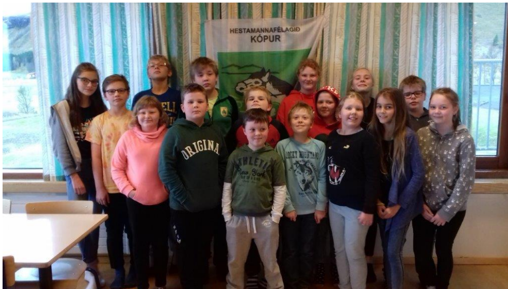
Krakkarnir sem tóku þátt í Hestklúbbi Hmf.Kóps 2017-2018.

Skipulagt æskulýðsstarf byrjaði í október 2017. Ákveðið var að verkefnið stæði frá október og út apríl. Það hófst á því að krakkar sem höfðu áhuga skráðu sig í hestaklúbb og mættu einu sinni í viku í október og nóvember. Þátttaka fór fram úr okkar björtustu vonum því 18 krakkar á aldrinum 10-15 ára skráðu sig og er það nokkuð gott því 43 börn eru á grunnskólaaldri í Skaftárhreppi. Við fengum inni í grunnskólanum á Kirkjubæjarklaustri og í námsverinu á Kirkjubæjarstofu. Hestaklúbburinn hófst með pizzuáti og glensi og var foreldrum boðið með í það.