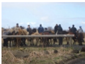
Áning í lok ferðar

Kerruferð var farin á vegum Æskulýðsnefndar auk Ferða- og skemmtinefndar Sóta í Hafnarfjörð samkvæmt vetrardagskrá. Í ferðina fóru 4 bílar með hestakerrur, 14 hestar og 14 knapar. Elísabet og Jón Trausti fylgdu á bílum með litlu börnin. Þau sem voru ríðandi voru 3 börn, 2 unglingar og 9 fullorðnir. Veðrið var eins og best var á kosið þrátt fyrir hagl og leiðindi áður en hópurinn lagði af stað af Nesinu. Var förin heitið að Sörlastöðum, en riðið var af stað frá kerruplaninu kl. 13:15 ca og var riðið fram í Sléttuhlíð þar sem farinn var góður hringur, en farið var áleiðis fram í Kaldársel.