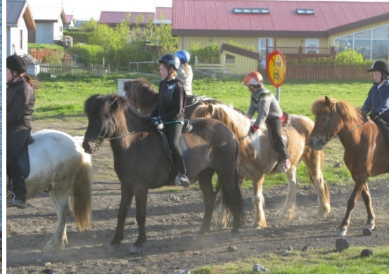
Veðrið lék heldur betur við okkur á Nesinu

Vonum við að börnin hafi ekki farið upp um alla veggja þegar heim var komið eftir allt sykarpúðaátið sem vel var tekið á. ;o)