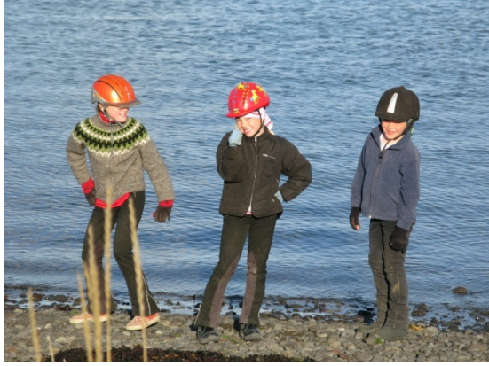
Fjaran heillar ;o)