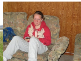
Ólafía María í slökun

Á laugardeginum var farið í sund í Borgarnes þar sem ungdómurinn missti sig í rennibrautunum eins og myndirnar sýna. Eftir að allir voru búnir að busla og slaka á var haldið heim í hús og fólkið fékk sér næringu eftir baðið og dreif sig svo í reiðtúr í þessu fína veðri. Þessi reiðtúr varð aðeins lengri en til stóð þar sem við náðum ekki að fara meðfram Hvítá nema áleiðis (niður með Ferjukoti) og yfir hana þar sem of mikið var í henni upp á að ríða með krakkana yfir. Þannig að snúa varð við og plampa veginn sömu leið til baka.