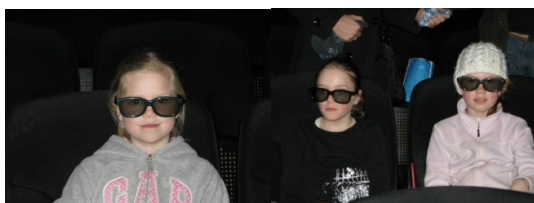
Allir rosaflottir með „sögleraugu“ í myrkrinu. ;o)