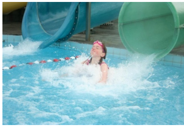
og Lóa líka