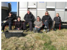
Slakað á í blíðunni ;o)