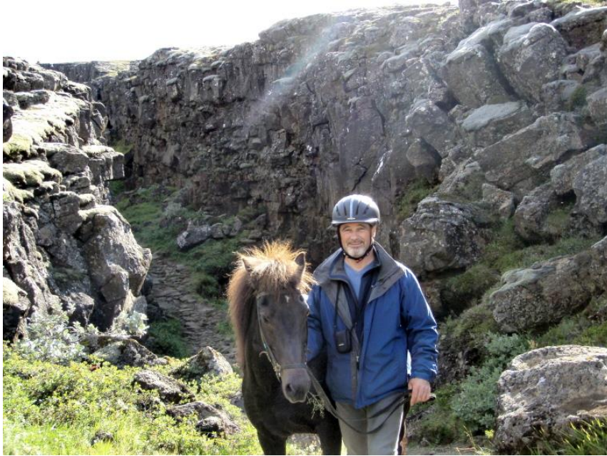
Langstígur / Stekkjargjá

Bílar og hestar samnýttu þessa vegi en sambúðin gekk stundum brösuglega, hestar áttu það til að fælast þetta undur sem bíllin var, en smá saman vandist þetta þó. Framan af síðustu öld var umferðarhraði ökutækja 18 ó 25 km á klst. Samnýtingin vega átti sér stað allt fram til árunna 1960 ó 70, þegar farið er að leggja vegi bundnu slitlagi í nokkru mæli og hraði umferðar eykst, sérstaklega í og við þéttbýli. Víða á sér þó enn stað samnýting vega í dreifbýli og á hálendinu.