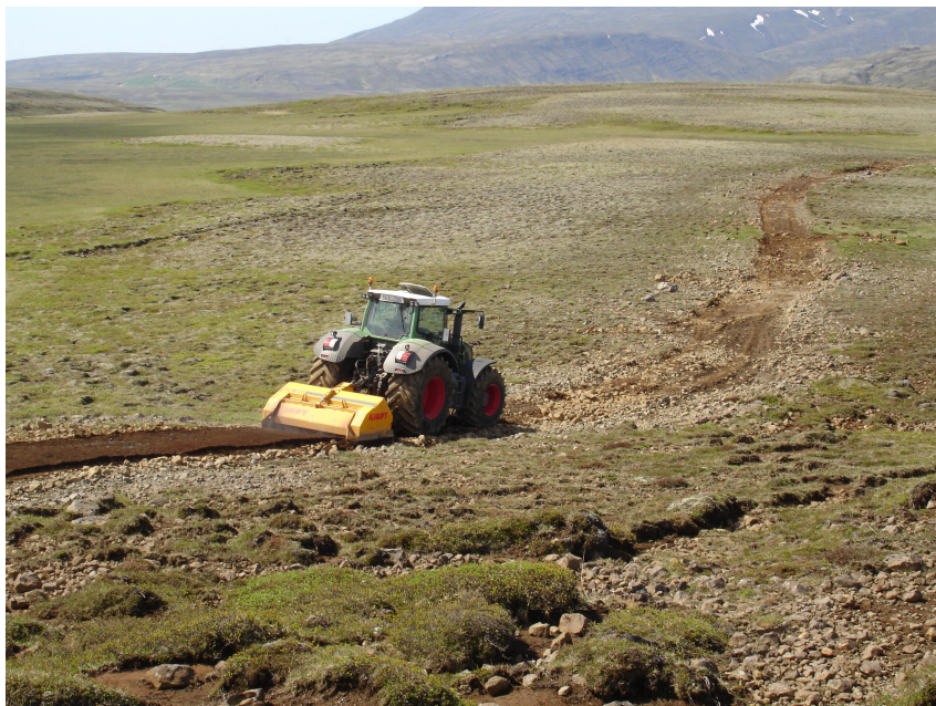
Steinbrjótur að störfum á Þingvallaleið

Steinbrjótur: Oftar en ekki er stærsti kostnaðarliðurinn við reiðvegagerð efnisflutningar og því hefur oft verið notast við gróft efni í yfirborð reiðveganna, eða efni sem er tiltækt nærri framkvæmdastað. Með tilkomu steinbrjóta sem geta malað gróft malarefni þannig að úr verði hæfilega gróft slitlag hefir orðið nokkurs konar bylting við reiðvegagerð. Sérstaklega á það við um staði þar sem erfitt er um efnisöflun. Steinbrjótarnir, sem eru bæði í eigu einkaaðila og Vegagerðarinnar, eru með um 200 cm vinnslu-breidd og 15 cm vinnsludýpt. Stærsta steinagerð getur verið 40 cm. Má segja að steinbrjótarnir séu byltingarkennd aðferð við reiðvegagerð.