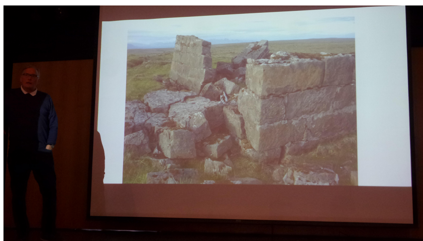
Bjarki Bjarnason segir frá gömlum götum á Mosfellsheiði