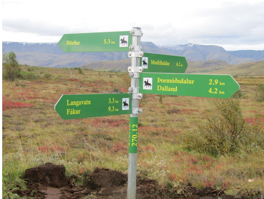
Vegprestur við Hafravatn

merkingar við reiðleiðir hjá sér er velkomið að leita í smíðju Spretts eða Harðar vegna reiðvega skilta. Hestamannafélagið Sörli vinnur að uppsetningu vegpresta á sínu svæði nú í haust eða komandi vori.